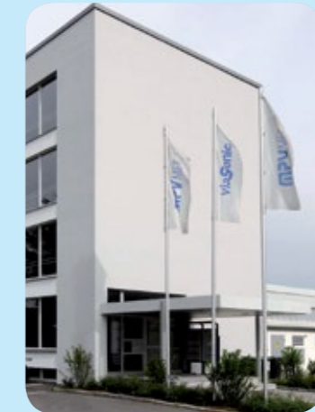
Putzbrunn b. München, Firmensitz